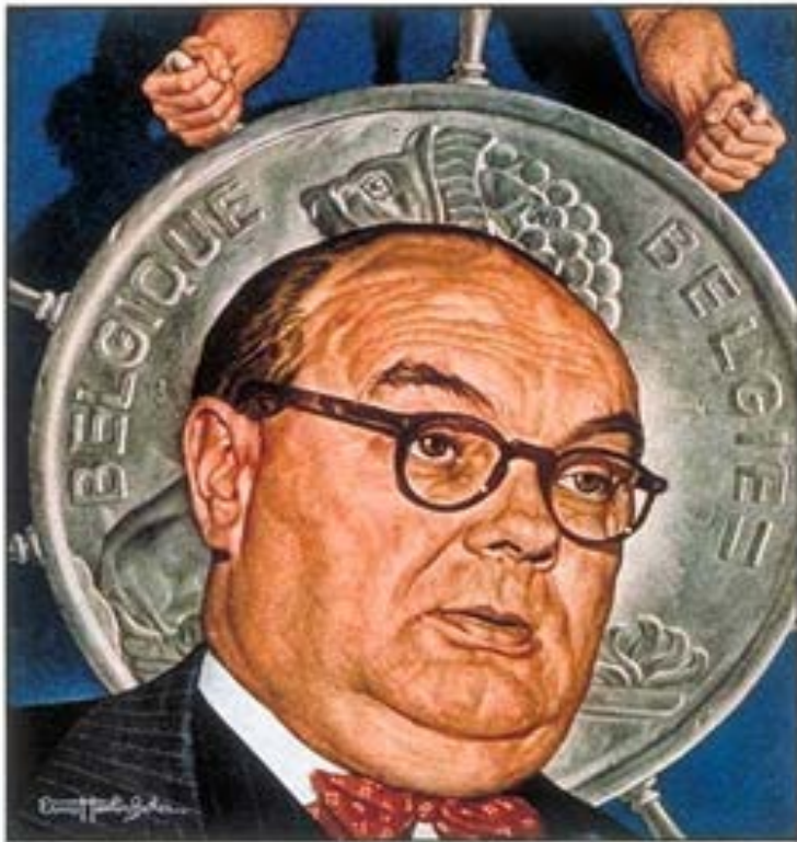
BELGIUM'S PREMIER, SPAAK Cake in the cupboard, faith in the future.

Paul-Henri Spaak (1899-1972) était un ancien Premier ministre belge et l'un des principaux architectes de ce qui est devenu l'Union Européenne. Ses paroles sont terriblement " prophétiques " concernant la crise mondiale actuelle :