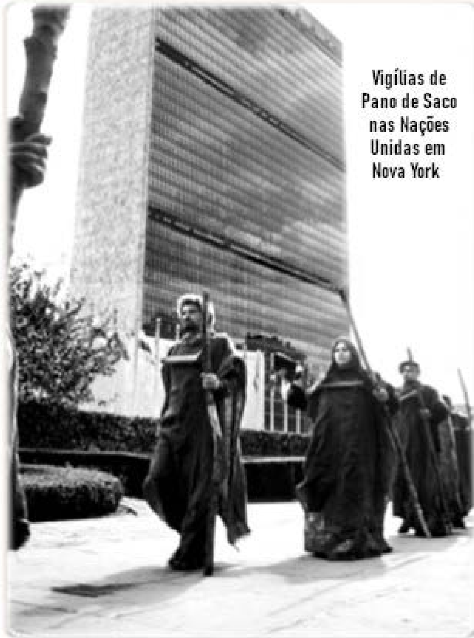
Vigílias de Pano de Saco nas Nações Unidas em Nova York