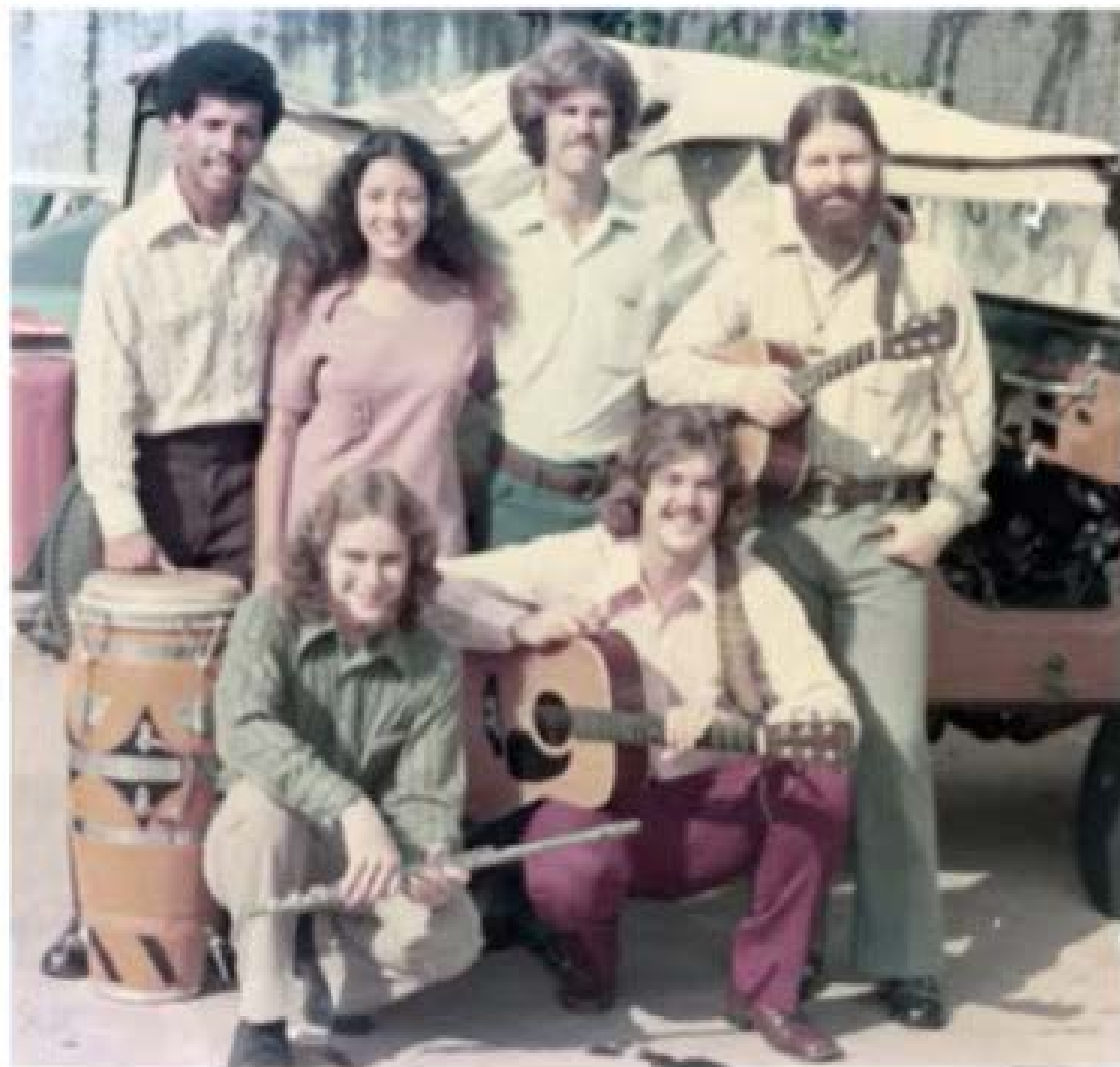
Puerto Rico, 1972